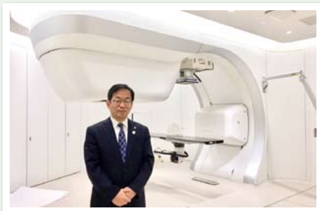
▲今秋より診療開始の「大阪重粒子センター」を視察 (11月20日)