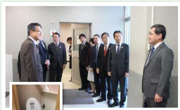
▲大阪府立清水谷高校を訪問、 改修工事済みトイレを視察 (12月13日)