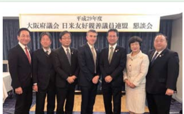
▲大阪府議会日米友好親善議員連盟総会・講演会・懇談会にて 講師のフィッシャウィック領事を囲んで (12月15日)