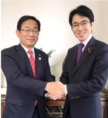
三宅府議と国重衆議院議員