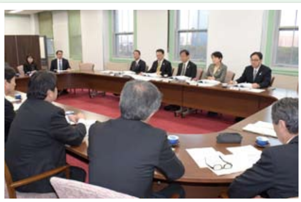
▲府下41市町村の政策要望を受ける (11月27日・藤井寺市)