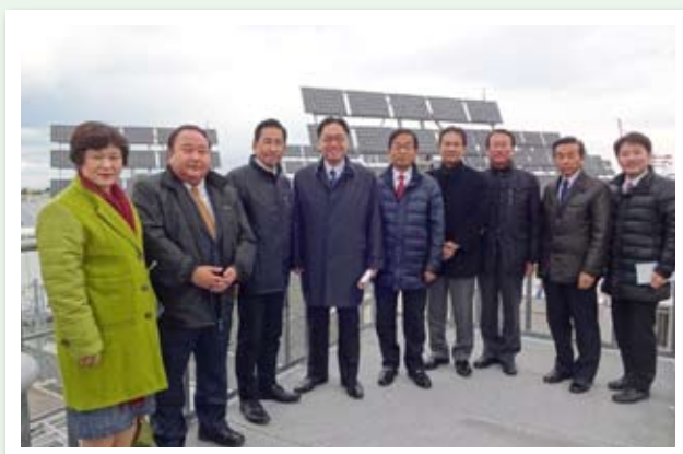
▲福岡県「北九州市エコタウンセンター」を視察 (12月6日)