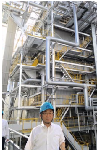
▲真庭バイオマス発電所 (岡山県真庭市)を視察(8/30)