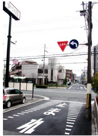
▲かごの屋(下新庄6-9)南側道路停止線を再塗装