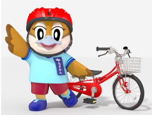
大阪府広報担当副知事 もずやん

自転車に関連する事故が全国最多の大阪府で、損害賠償保険への加入を義務付ける府条例が7月1日施行されました。賠償額の高額化などが背景にあり、義務化は兵庫に次いで2番目。この条例は、府内で自転車に乗る人はすべて対象になりますが、罰則はありません。加入を求めるのは自分のけがに備える傷害保険ではなく、他人にけがをさせた場合などに備える個人賠償責任保険。自動車や火災などの保険の特約に含まれているケースもあります。未成年者は保護者が加入の義務を負います。