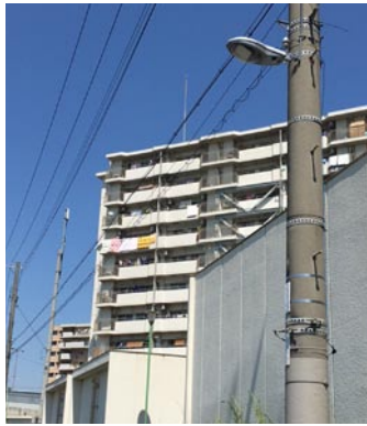
▲市営北陽住宅周辺に街灯4基設置