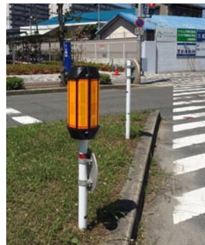
▲西淡路5丁目延原倉庫前に反射ボールを設置