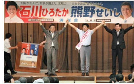
▲個人演説会(東淀川区民ホール7月3日)

我が党に寄せられた皆様のご期待とご信頼にお応えするため、さらに全議員が心をひとつに団結し、お約束した政策の実現に全力で取り組んでまいります。