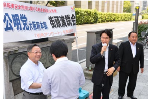
アンケートへの協力を呼びかける国重衆議院議員(2014.6.1)

公明党は、これまで大阪府議会において自転車の安全利用に向けた対策を重点的に取り組むべきと繰り返し訴えてきました。党府本部においても、2014年夏に府内全域で「自転車安全利用に関するアンケート」を実施。8万人以上の府民の皆様にご協力をいただきました。アンケート調査からも賠償保険加入義務付けのお声は多数寄せられていました。