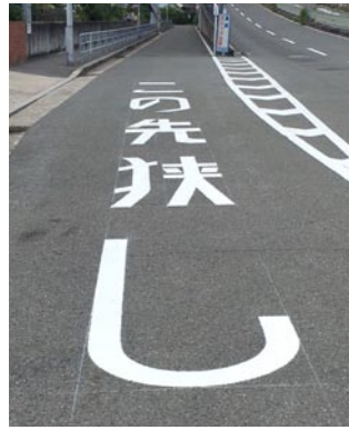
▲新大吹橋側道に大型車進入規制「この先狭し」を路面表示