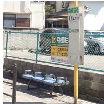
▲淡路4丁目バス停にベンチ設置